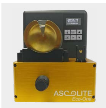
Horquilla de calor en posición ergonomica