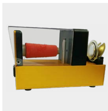
YRS® – Sistema para garantizar la calidad del hilo, con tecnología RFID.

La nueva posición ergonómica de la horquilla de calor acelera el proceso de trabajo y logra la máxima unión térmica del hilo Ascolite. La antena de reconocimiento de hilos (YRS) garantiza los mejores resultados para proteger los botones.