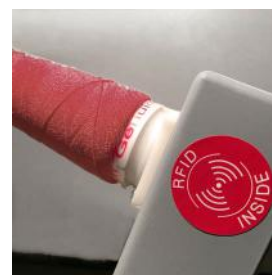
YRS® - 我们的专有系统, 通过RFID技术保护客户质量标准