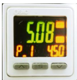
电子气压表, 可防止机器在运行过程中发生故障