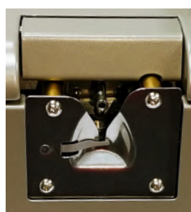
自动穿线配合独特的纱线管控开关 (YMS)