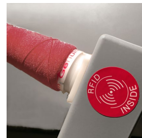
YRS® - 我们的专有系统, 通过RFID技术保护客户质量标准